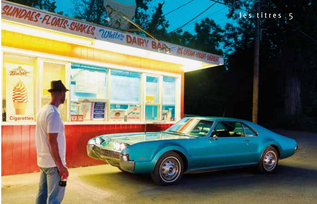
Chaque année, Standox charge un photographe réputé de créer un calendrier Standox original.

À terme, les publicités ont été remplacées par les photos d'une jolie blonde, qui portait avec élégance une combinaison de travail orange et tenait à la main un pistolet de peinture. Nous vous présentons Standoxy. Elle a été le visage de Standox vers la fin des années 60 et a donné une image fraîche et sympathique à la marque. Le résultat était inéluctable : Standoxy était adorée au sein des ateliers de carrosserie parce qu'en plus d'apparaître dans les publicités, elle se déplaçait pour féliciter personnellement les gagnants des concours.