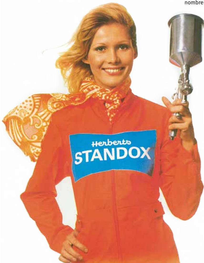
Le visage de Standox dans les publicités de la fin des années 60 : Standoxy ne se contentait pas de sourire sur les affiches, elle se déplaçait et participait à des événements.

atypiques. Les ateliers de carrosserie recevaient des affiches qui fournissaient des informations sur les produits Standox actuels au recto mais qui présentaient également au verso des illustrations amusantes sur des situations quotidiennes au sein de l'atelier. Un bon exemple de cette approche originale est la visite à l'atelier d'une dame très à la mode qui souhaitait que sa voiture soit peinte en « jaune œil de faisan ». Comme échantillon de couleur, elle avait apporté un faisan vivant à l'atelier. Sans sourciller, le carrossier peintre attrapait tout bonnement le livre des teintes Standox. Ces caricatures humoristiques et chaleureuses, qui capturaient si bien l'esprit de l'époque, étaient très appréciées des carrossiers. Elles sont restées sur les murs de certaines carrosseries pendant de nombreuses années.