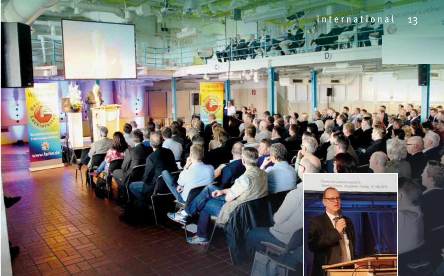
Cette année, le Lackierertag a été organisé par Standox à Wuppertal.