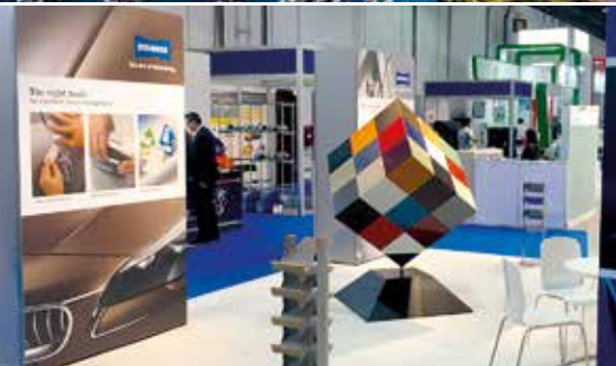
Le stand de Standox au salon Automechanika de Dubaï